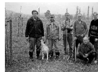
ALEJE. K činnosti včelařů z Čakova a okolí patří i sázení alejí.

K čakovské organizaci patří i Budějčáci. Na venkov za pilnými dělnicemi dojíždí